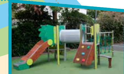
Un nouveau jeu