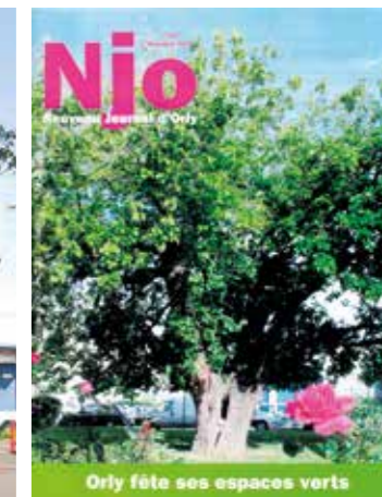
▲ En 2007, le mûrier faisait la Une du journal d'Orly.