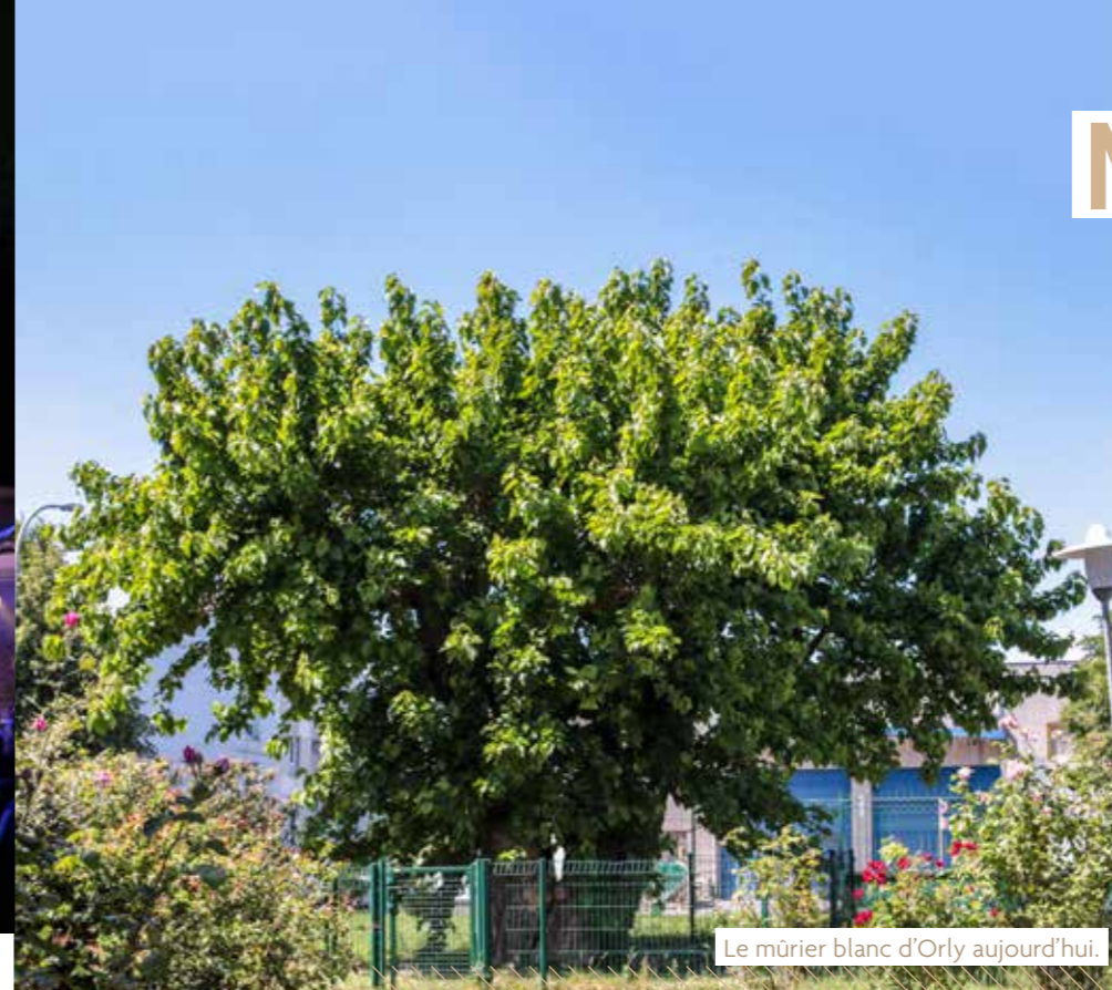
Le mûrier blanc d'Orly aujourd'hui.