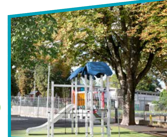
Deux nouveaux jeux

Les travaux d'agrandissement et de rénovation de l'école Noyer-Grenot ont bien progressé ces dernières semaines. Ils se poursuivront jusqu'à l'été 2021. Plus d'informations en page 9.