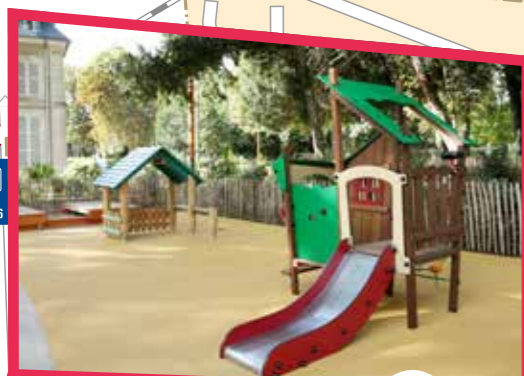
Pour les tout-petits

Pour le bien-être des tout-petits, une nouvelle climatisation a été installée dans le dortoir de la maternelle Paul Éluard.