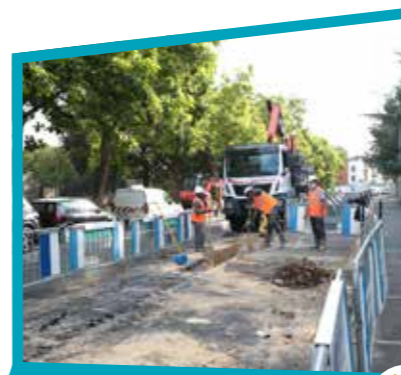
Rue Pierre Corneille