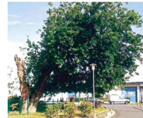
▲ Le mûrier d'Orly, régulièrement victime des intempéries.

Lors de la construction de la résidence, les architectes ont pris en considération l'emplacement de l'arbre pour permettre de le sauver. Un peu plus tard, alors que le tronc commençait à se fendre, des barres