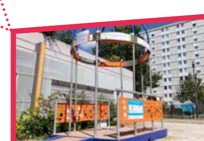
Tous au frais

L'aménagement du Tram 9 se poursuit, à travers la ville. Plus d'infos en page 19.