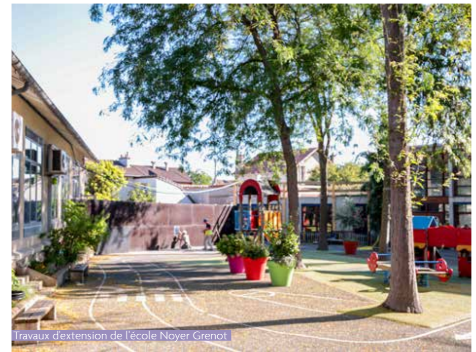
Travaux d'extension de l'école Noyer Grenot