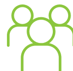
LES ORLYSIENNES ET LES ORLYSIENS