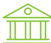
LA VILLE D'ORLY