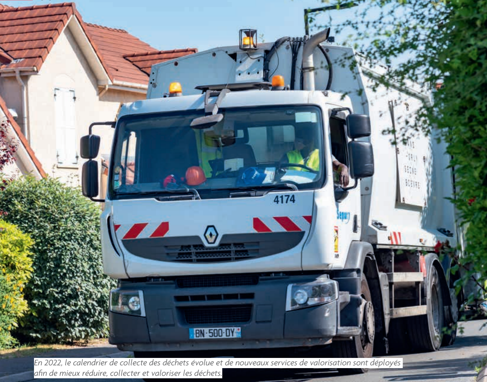
En 2022, le calendrier de collecte des déchets évolue et de nouveaux services de valorisation sont déployés afin de mieux réduire, collecter et valoriser les déchets.