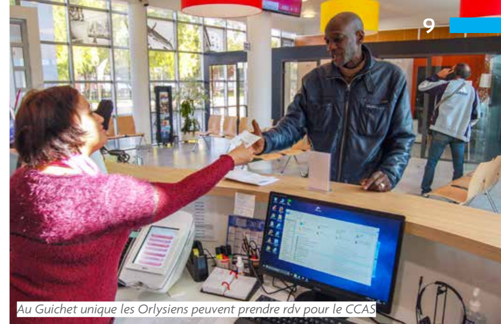
Au Guichet unique les Orlysiens peuvent prendre rdv pour le CCAS

Enfin, des bourses annuelles de rentrée scolaire et de fin d'année (calculées