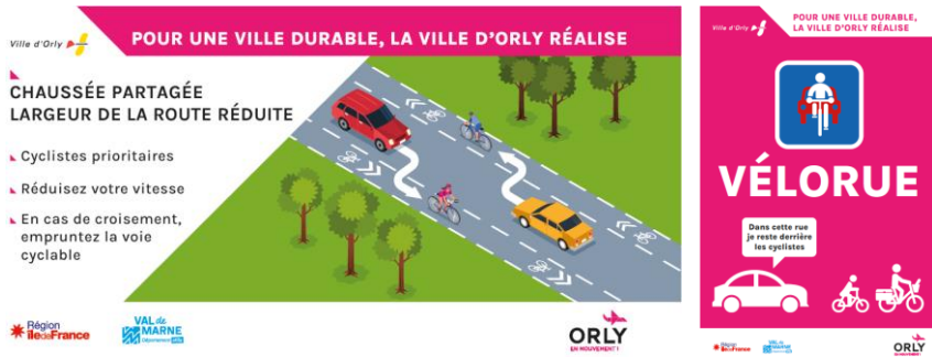
Schéma de principe de la voirie en « chaussidou » et en Vélo Rue

La VELORUE donne la priorité de circulation et de vitesse au cycliste.