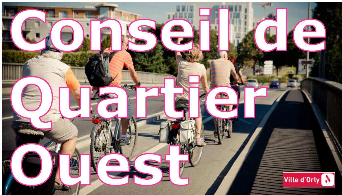
Illustration d'une mobilité douce en ville. Le Quartier Ouest accueille les premières pistes cyclables du Plan de Mobilité douce d'ORLY.