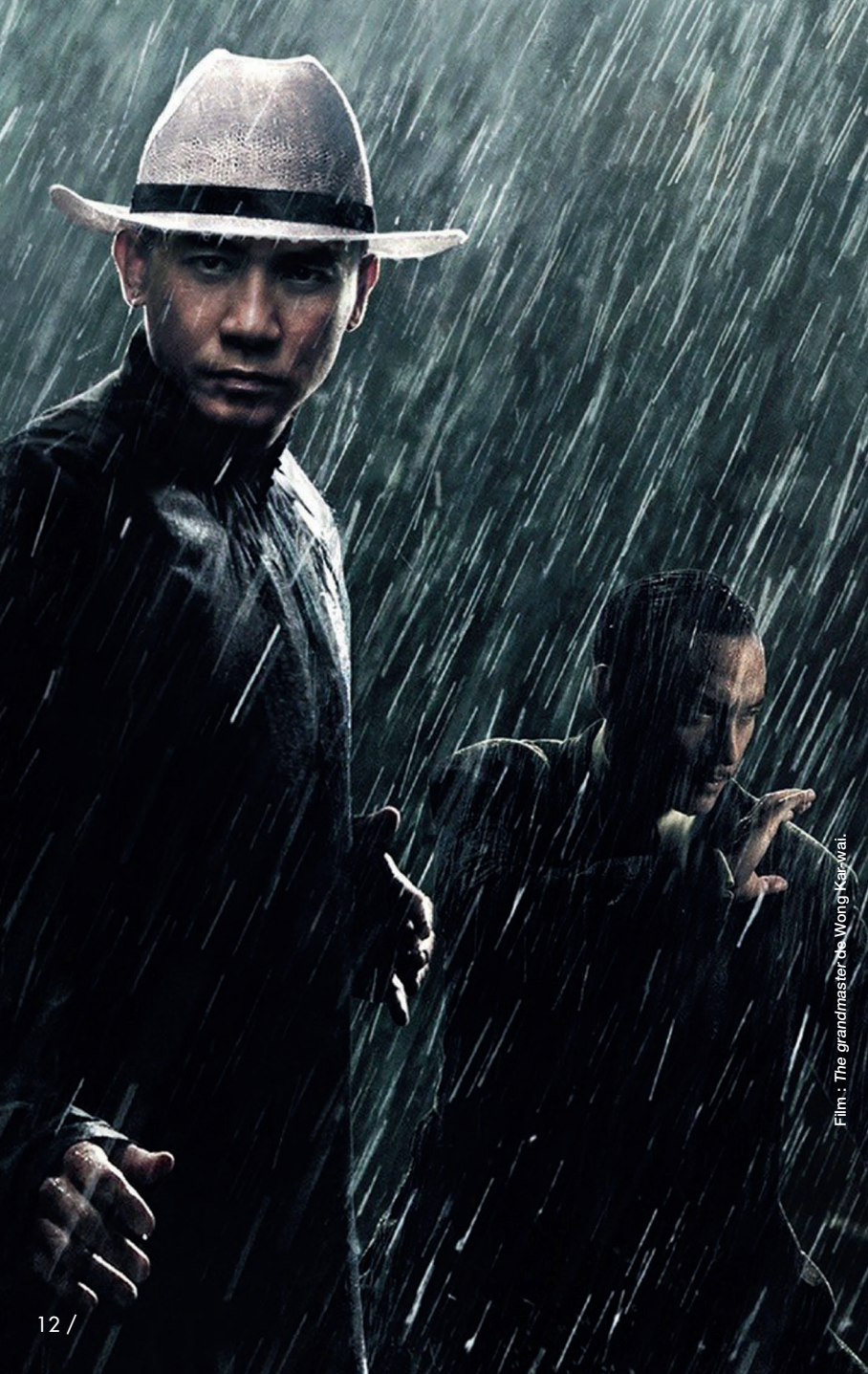
Film : The grandmaster de Wong Kar-wai.