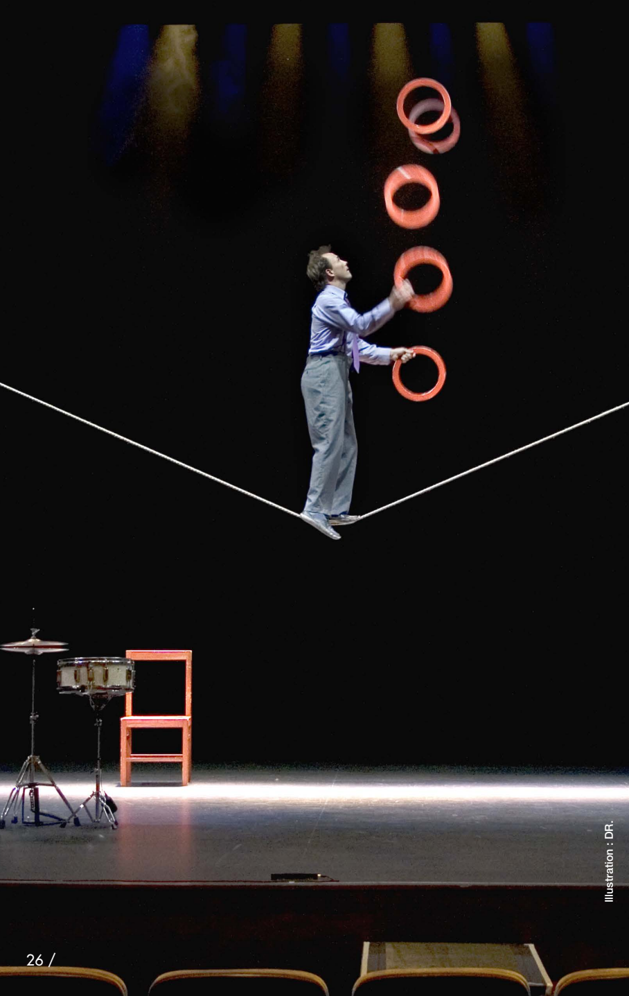
Illustration : DR.