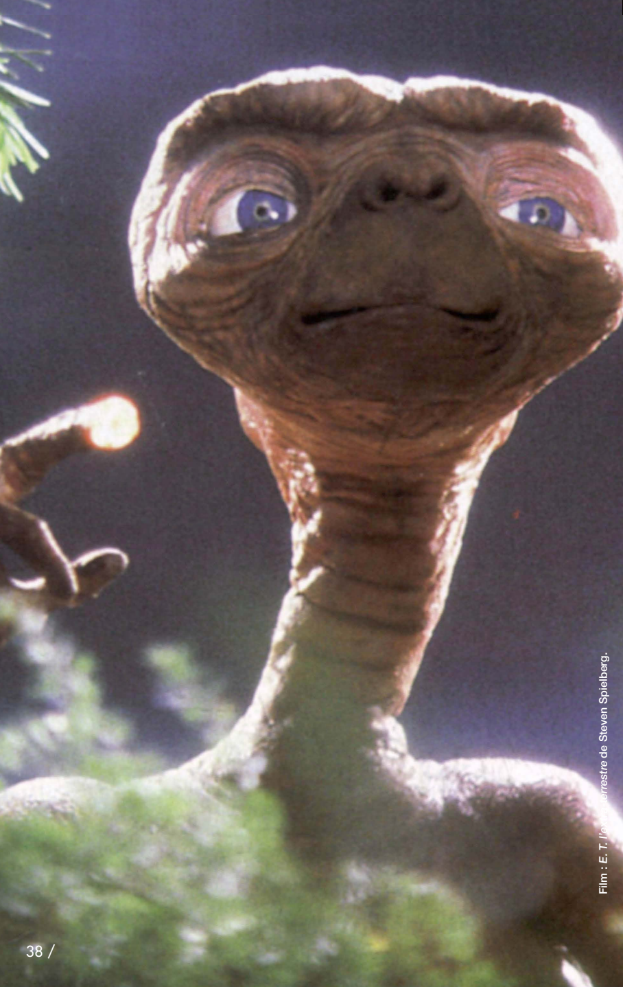
Film : E. T. l'extra-terrestre de Steven Spielberg.