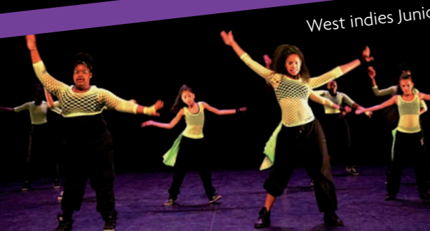
West indies Junior

Organisée dans le cadre de la semaine des expressions urbaines, cette soirée de clôture a permis aux 450 Orlysiens présents de découvrir la richesse des différents styles chorégraphiques locaux. Sur scène, 7 groupes orlysiens étaient à l'honneur : Quartiers dans le monde, Epsilon Crew, Epsilon Junior, Orlywood Kids, Slaywic, The Only unity et West indies Junior. Sous la houlette de Jacques Fargearel, la création collective Composite chorégraphiée par les associations et la Compagnie du sillage, en résidence à Orly, concluait cette belle soirée.