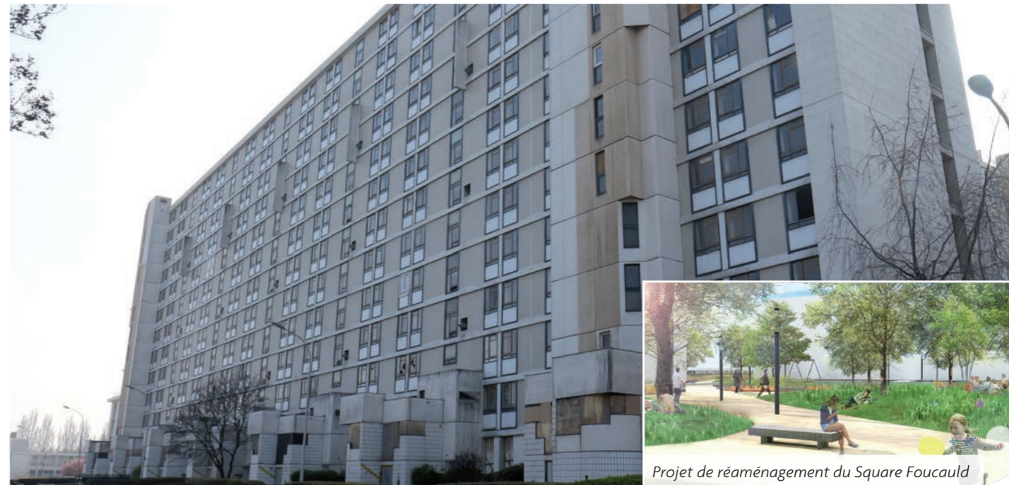
Projet de réaménagement du Square Foucauld

Le chantier de démolition du Grand Colomb marque une nouvelle étape de la rénovation complète du quartier des Navigateurs.