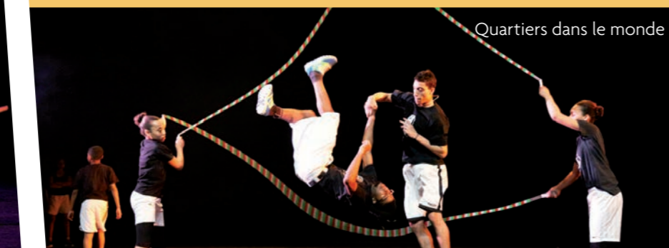
Quartiers dans le monde