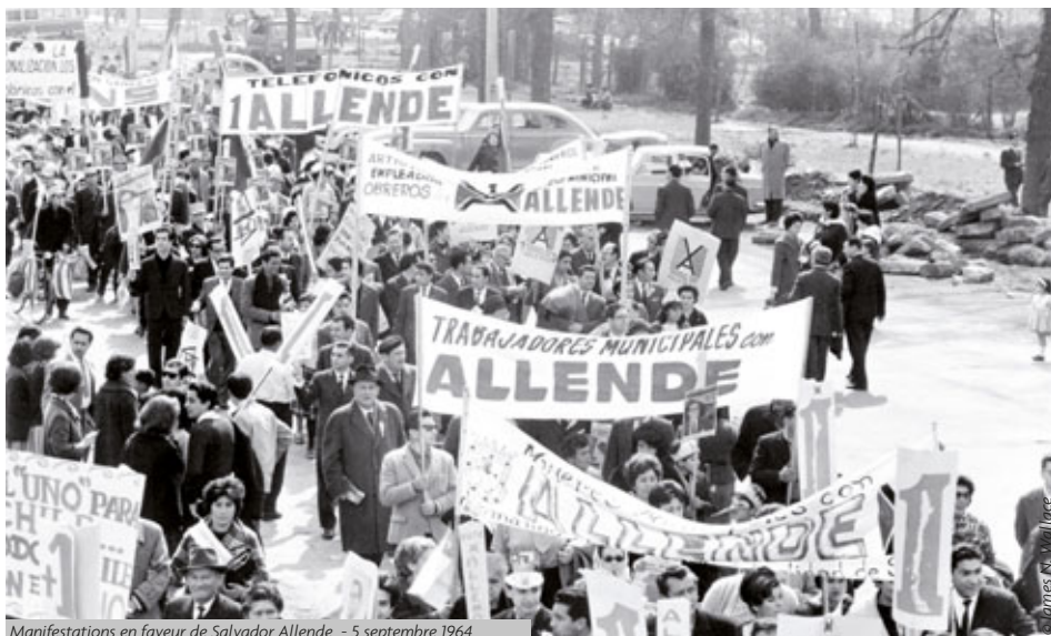
Manifestations en faveur de Salvador Allende - 5 septembre 1964

Mardi 11 septembre, comme chaque année, les Orlysiens se retrouveront pour commémorer la mémoire de Salvador Allende, ancien président du Chili. Salvador Allende a donné sa vie pour son pays, le Chili. Fondateur du parti socialiste, 3 fois candidats à l'élection présidentielle et à chaque fois battu, c'est en 1970 qu'il est élu président de la République et s'engage dans la transformation socialiste de son pays. Cette obsession pour le respect de la loi, va lui