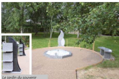
Le jardin du souvenir

Durant tout l'été, les services de la ville ont effectué des travaux d'aménagement, d'entretien et de voirie. Côté aménagement, le Centre culturel est désormais équipé pour accueillir dès septembre le cinéma numérique. L'école maternelle Jean Moulin est dotée pour la rentrée d'un bungalow d'une superficie de 60m 2 destiné au centre de loisirs. Dans toutes les écoles et les squares, les services de la ville ont procédé à l'entretien et la mise en sécurité des aires