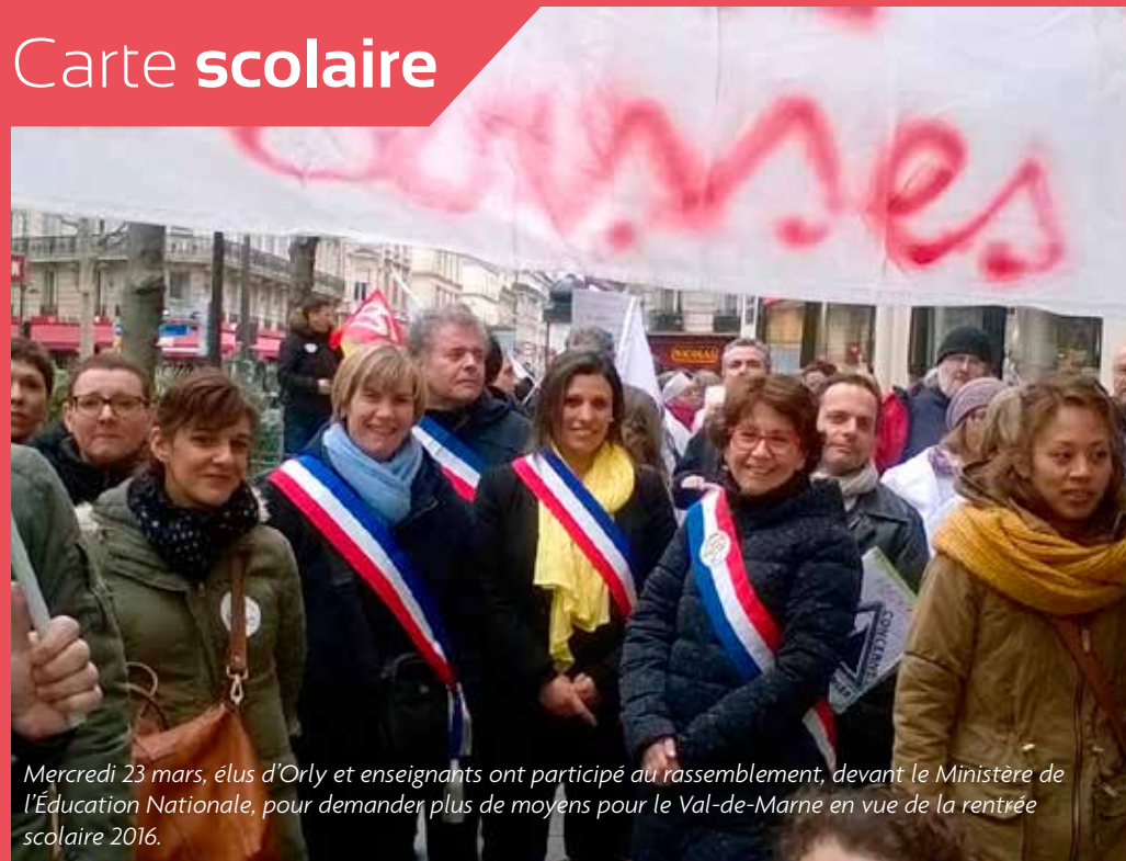
Mercredi 23 mars, élus d'Orly et enseignants ont participé au rassemblement, devant le Ministère de l'Éducation Nationale, pour demander plus de moyens pour le Val-de-Marne en vue de la rentrée scolaire 2016.