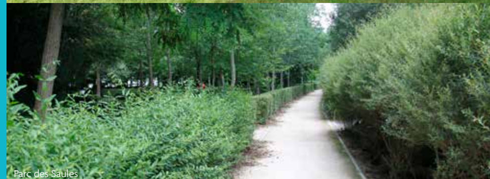
Parc des Saules