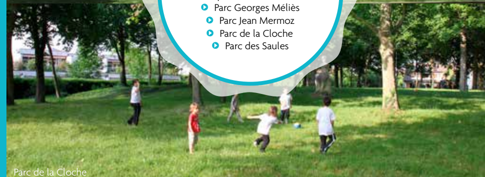
Parc de la Cloche