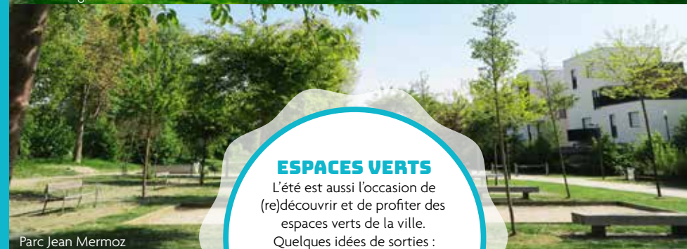
Parc Jean Mermoz