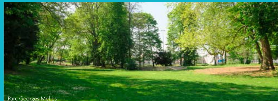
Parc Georges Méliès