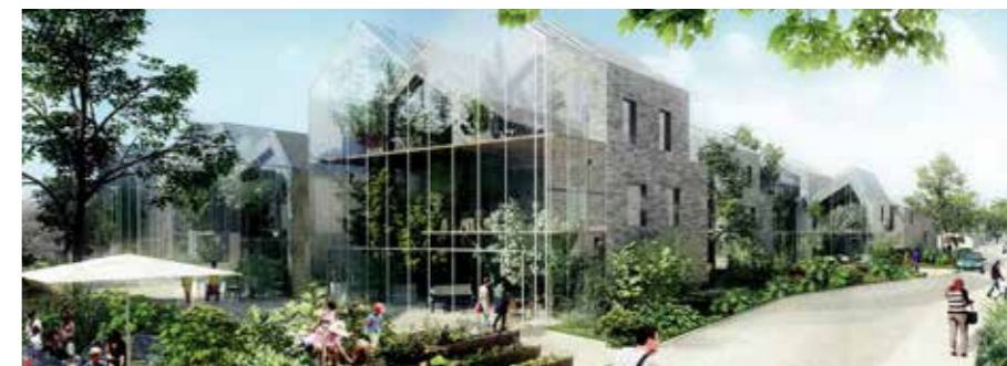
▲ C'est un tout nouveau quartier qui prendra vie à proximité du chemin des Carrières.

La question des transports en commun est également primordiale dans la dynamique d'une ville durable. Tramway T9, métro M14, gare Tgv, transport en commun en site propre sur le Senia permettront à terme de favoriser la mobilité des Orlysiens (voir dossier p.6) et par voie de conséquence leur accès à l'emploi du bassin aéroportuaire.