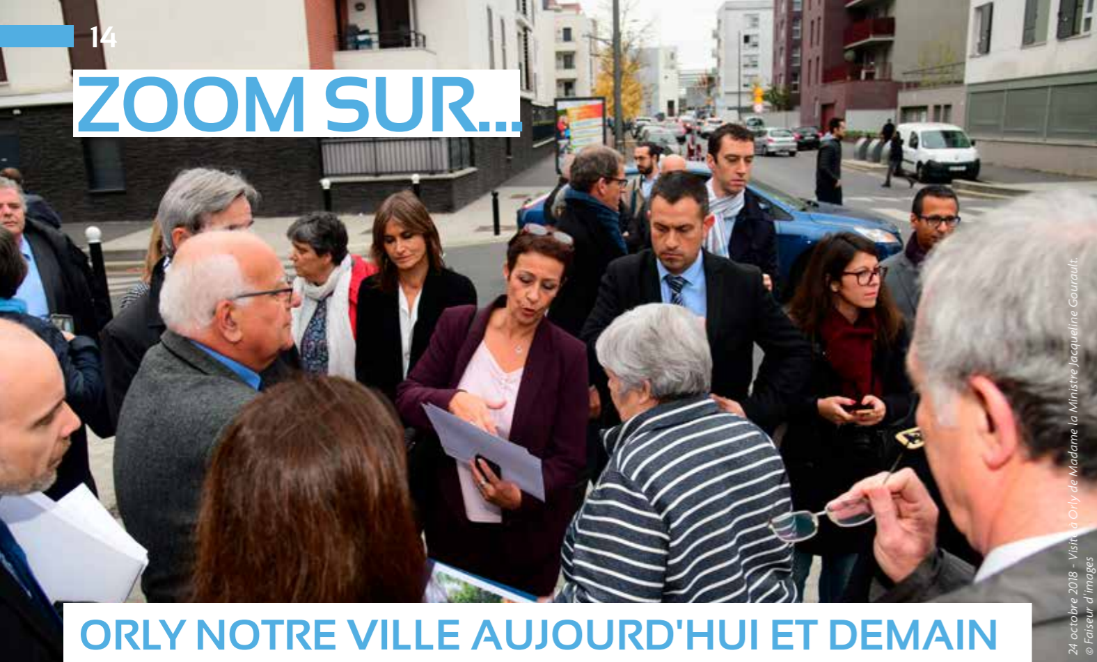
24 octobre 2018 - Visite à Orly de Madame la Ministre Jacqueline Gourault.