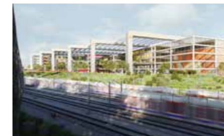
▲ Un immense pôle dédié au e-sport sera créé à l'Ouest d'Orly.

Ce quartier bénéficiera notamment de l'appel à projets « Inventons la Métropole du Grand Paris ». Grâce à ce dispositif, pour lequel les villes d'Orly et de Thiais ont candidaté, des équipes d'urbanistes travaillent à la création de projets innovants sur le secteur. Un pôle de 25 000m 2 dédié au e-sport (sport virtuel) et à la réalité virtuelle sera notamment construit sur la partie thiaisienne du quartier. Il regroupera une plateforme consacrée au sport virtuel (salle de spectacle et de compétition, studio d'enregistrement...), un pôle de réalité virtuelle avec un escape game et un cinéma en réalité virtuelle à 360°, un pôle de formation et incubateur dédié aux nouvelles technologies, et un pôle de sports urbains connectés.