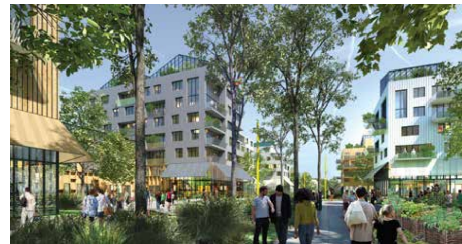
▲ Le secteur des Quinze Arpents, à cheval entre Orly et Thiais, deviendra demain un quartier dynamique et vivant.

Pour répondre à la demande croissante de logements, tout en préservant la place de la nature à travers le territoire, la ville d'Orly se prolongera demain jusqu'à Thiais, à l'Ouest de la commune. La partie Sud de l'actuelle zone d'activités du Senia sera en effet complètement métamorphosée, pour donner vie à deux nouveaux quartiers, mêlant habitations, espaces verts, commerces et équipements publics.