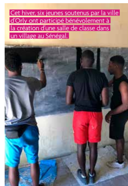
Cet hiver, six jeunes soutenus par la ville d'Orly ont participé bénévolement à la création d'une salle de classe dans un village au Sénégal.

À chaque fois, les bénéficiaires s'engagent à partager leur expérience avec les habitants de la ville, lors d'événements jeunesse par exemple.