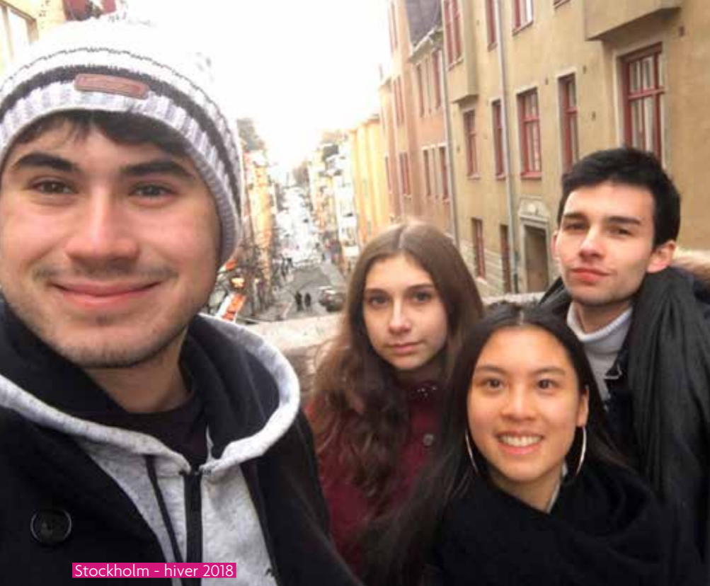
Stockholm - hiver 2018