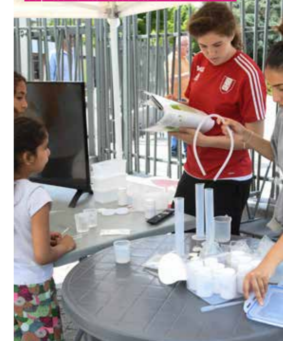
Animation autour de l'importance de préserver les ressources en eau – été 2018

Dans les structures aussi, des actions d'information et de sensibilisation sont déployées. À l'automne dernier, des intervenants sont par exemple venus expliquer aux jeunes les dangers liés à l'utilisation des deux roues : comment bien se protéger et s'équiper, comment réagir face à une situation urgente... Plusieurs temps d'échanges autour des risques d'Internet et autour du cyberharcèlement ont également été organisés à la fois avec les parents et avec les jeunes.