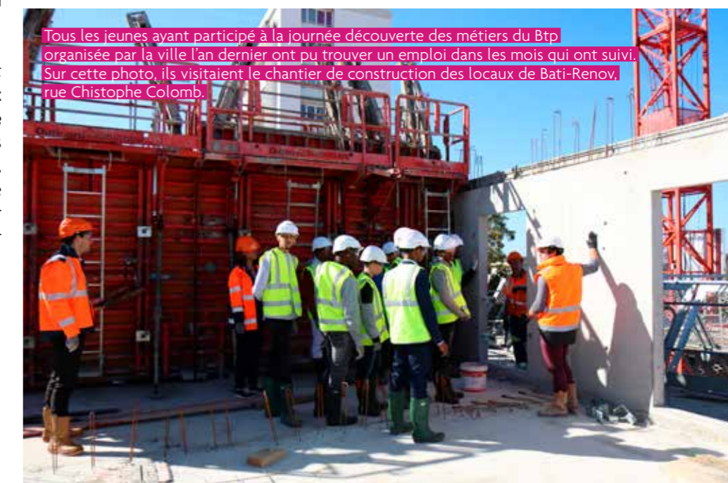
Tous les jeunes ayant participé à la journée découverte des métiers du Btp organisée par la ville l'an dernier ont pu trouver un emploi dans les mois qui ont suivi. Sur cette photo, ils visitaient le chantier de construction des locaux de Bati-Renov, rue Christophe Colomb.

Cette année, trois journées d'ateliers gratuits autour de l'emploi et de la création d'entreprise seront mises en place (voir article page 23). Le 26 mars prochain, le premier temps fort sera consacré à l'emploi et à la création d'entreprise au féminin. Il sera suivi de rendez-vous dédiés aux 16-35 ans en juin et aux métiers de la logistique à l'automne.