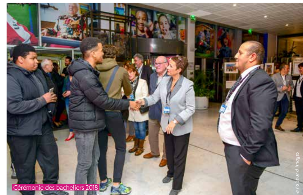
Cérémonie des bacheliers 2018

Le forum jeunesse Pablo Neruda restera ouvert jusqu'à ce que la nouvelle structure puisse prendre le relais.