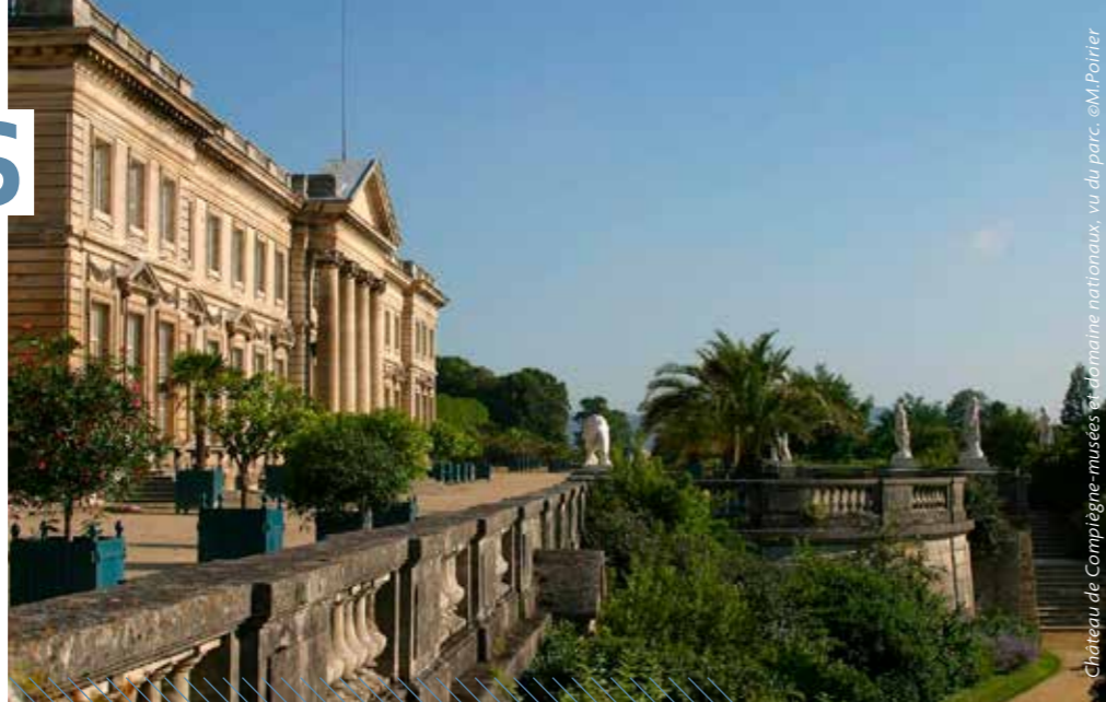
Château de Compiègne-musées et domaine nationaux, vu du parc.